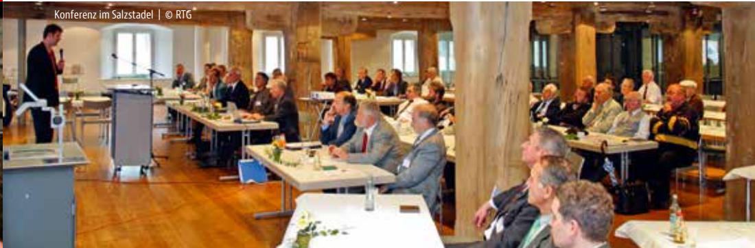
Konferenz im Salzstadel