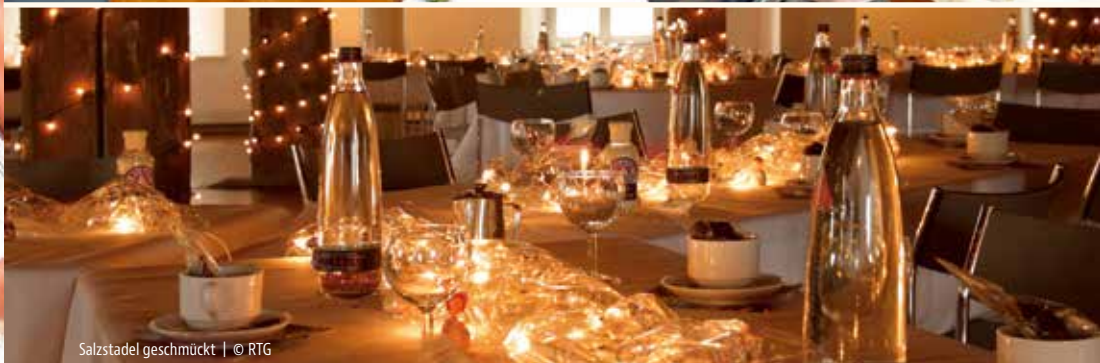
Salzstadel geschmückt